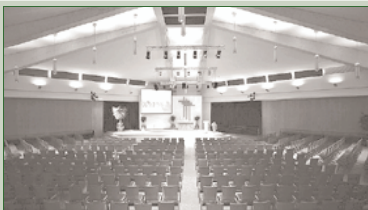
♥-lich Willkommen in der Evangeliumshalle Wehrda. Die Evangeliumshalle, die 2008 saniert wurde, erhielt eine neue, moderne Beleuchtungs- und Beschallungsanlage. Der Versammlungsraum verfügt über 500 Sitzplätze und vier Nebenhallen, so dass bis zu 1800 Personen Platz finden.

Es grüßt Sie herzlich das Vorbereitungsteam des RV Hinterland